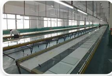
Screen Printing Workshop