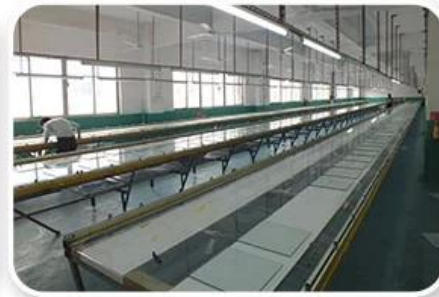
Screen Printing Workshop