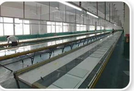
Screen Printing Workshop