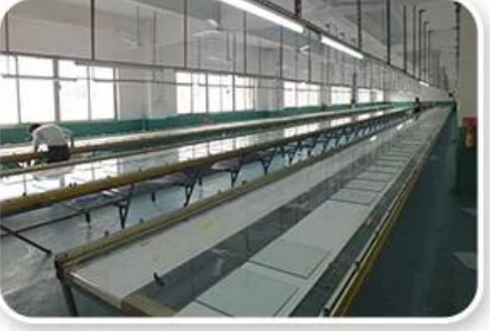
Screen Printing Workshop