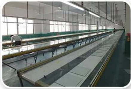
Screen Printing Workshop