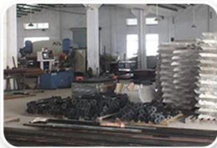
Screen Printing Workshop