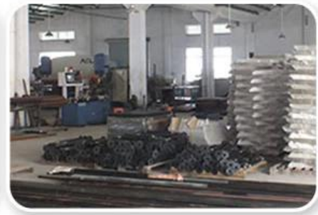
Screen Printing Workshop