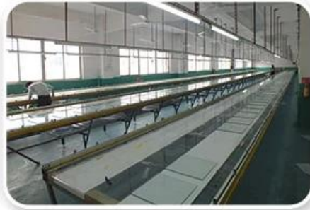
Screen Printing Workshop