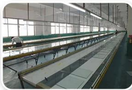
Screen Printing Workshop